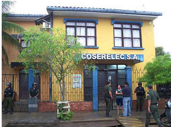
La Compañía de Servicios Eléctricos S.A., se encuentra bajo custodia policial a solicitud del Gobierno Central

La entidad reguladora, decidió asimismo el 23 de septiembre de 2008, reforzar sus decisiones disponiendo mediante Resolución No. 327, la suscripción de un convenio entre la Superintendencia de Electricidad y COSERELEC para garantizar la normal provisión del servicio y la continuidad de la compañía sobre la concesión de distribución de electricidad en la ciudad de Trinidad.